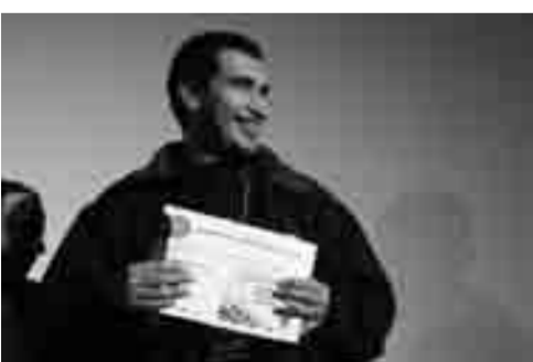
REMISE DE PRIX: CINEMA JEUNES TALENTS 2, droits réservés