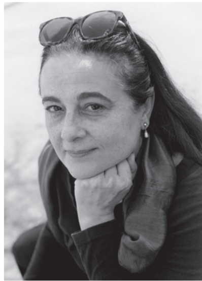
SIMONE BITTON, droits réservés