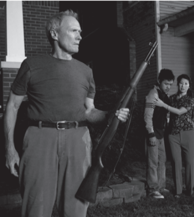
GRAN TORINO