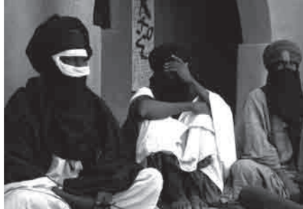
FURIGRAPHIER LE VIDE, droits réservés

DIMANCHE 13.12 A 17:00 SUIVI D'UN DEBAT AVEC DES TEMOINS: MEDECIN, JOURNALISTE, REALISATEUR, MEMBRE ACTIF DE LUTTE CONTRE LE SIDA.