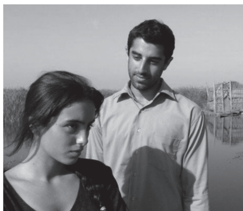
L'AUBE DU MONDE