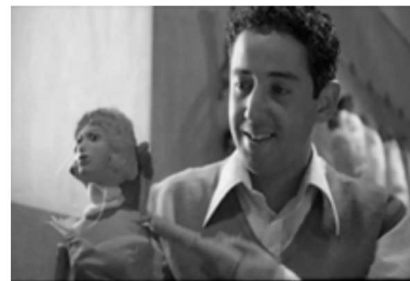
Tissé de mains et d'étoffes

Leur père proche de l'heure de la mort, une jeune étudiante et un enfant handicapé mentale voient venir un autre drame: l'injustice flagrante qu'une société n'hésite pas à mettre en œuvre au nom d'une inégalité, religieusement admise, entre les hommes et les femmes, en matière d'héritage.