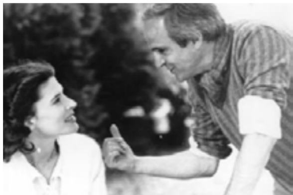
François Truffaut et Fanny Ardant

Dans La Nuit Américaine (1974), Truffaut fait dire à Jean-Pierre Léaud ce qui peut être compris comme une des questions qui traverse l'œuvre du cinéaste : Est-ce que les femmes sont magiques ? Et elles le sont pour Truffaut. D'abord en raison de la passion du cinéaste pour les actrices : de Jeanne Moreau à Fanny Ardant, en passant par Catherine Deneuve, et Bernadette Laffont. Mais c'est aussi la femme en ce qu'elle incarne la passion fatale et un mystère qui résistent à la raison. De La Peau Douce, à La Femme d'à Côté, Truffaut n'a eu de cesse de chercher à percer ce mystère, tout en l'épaississant toujours davantage. Il rejoint ainsi ses maîtres qui ont transformé la femme en véritable sujet de cinéma, à l'image de celui qu'il admirait le plus parmi eux : Alfred Hitchcock.