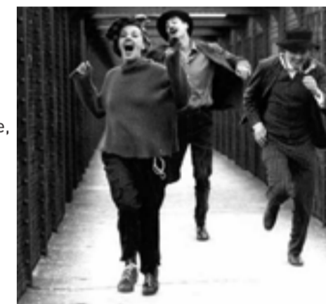
Jules et Jim